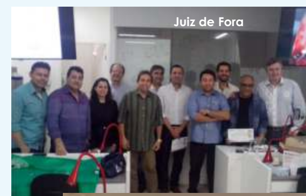
Juiz de Fora

Para o CEVO a tecnologia deve estar a serviço de melhorar a vida e a saúde da população. Assim, estamos disseminando a técnica da Fibrina pelo Brasil afora, através do que chamamos de "Caravana da Fibrina". A intenção é de alcançar o maior número de profissionais, no sentido de torná-los habilitados nessa nova filosofia de associar a Fibrina ao tratamento, que permite a realização de implantes de maneira mais eficaz, rápida, segura e, sobretudo, com maior qualidade. Este ano a Caravana já percorreu as cidades de Juazeiro, Petrolina, Baurú, Salvador, Londrina, Maringá, Araraquara, Caruaru, Juiz de Fora.